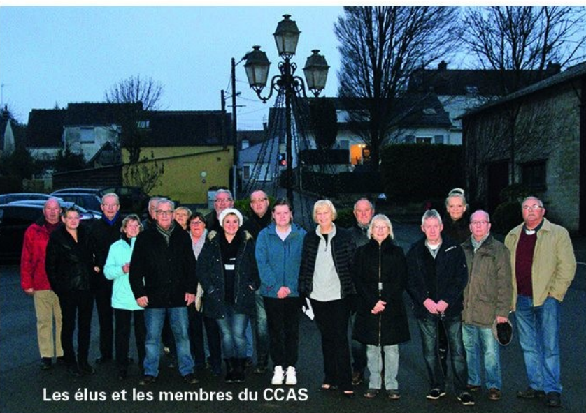
Les élus et les membres du CCAS